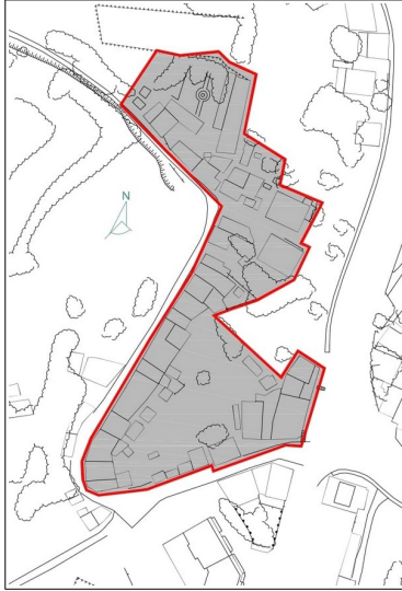
Barrio da Magdalena